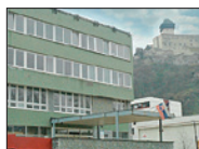
Expozitúra NKÚ SR Trenčín