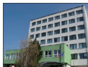
Expozitúra NKÚ SR Nitra