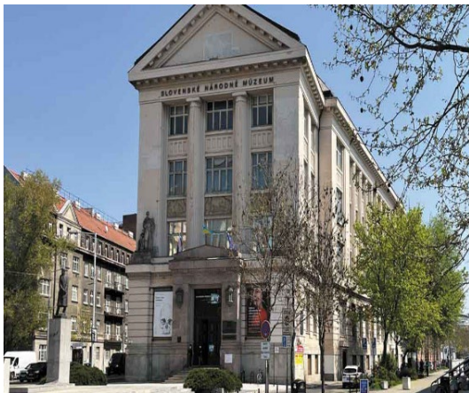
Obr. č. 4, 5: Havarijný stav základovej škáry sídelnej budovy SNM