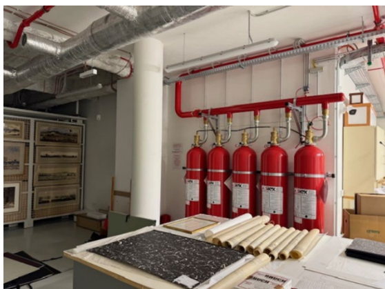
Obr. č. 1, 2: Depozitáre SNG po rekonštrukcii (dobrá prax)