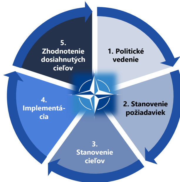
Obr. 1: Proces obranného plánovania NATO

Zdroj: Informácia MO SR pre vládu SR z procesu hodnotenia obranných plánov SR 2019/2020, spracovanie NKÚ SR