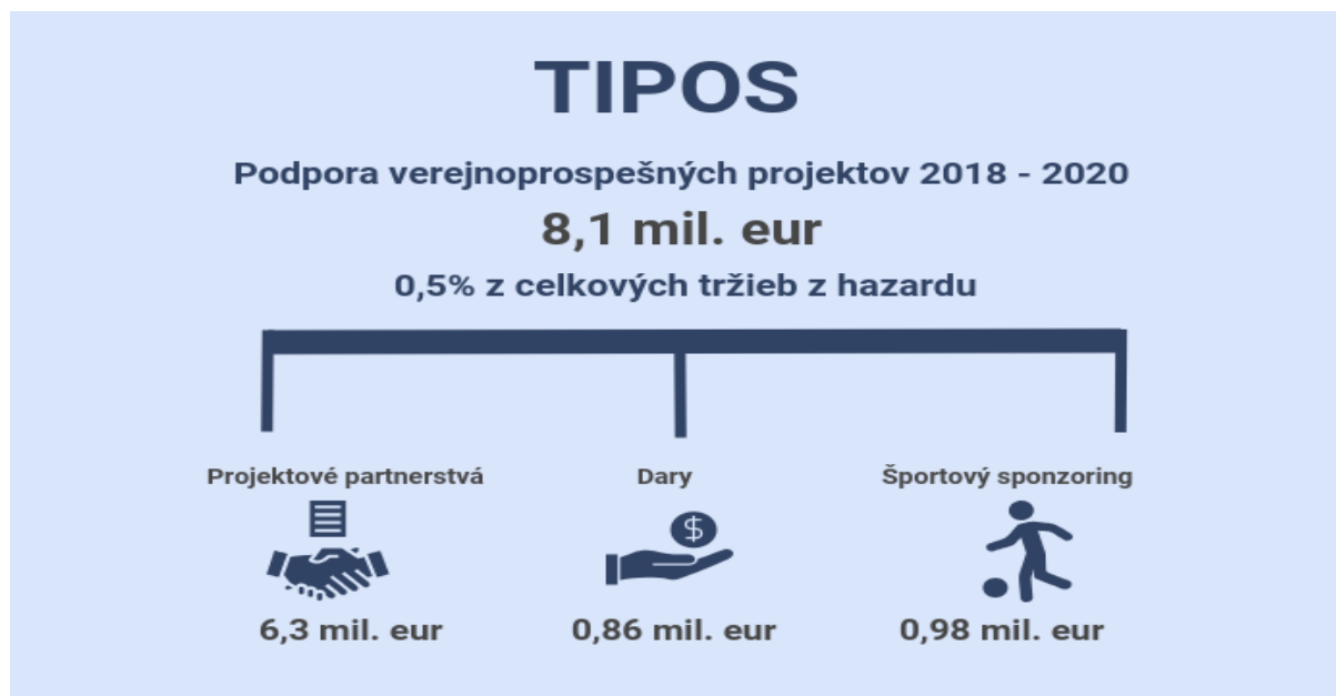
Graf č. 3 Podpora projektov priamo financovaných spoločnosťou TIPOS

Proces rozdeľovania týchto peňazí na konkrétne projekty však podľa NKÚ SR vykazoval prvky nižšej transparentnosti a objektivity. NKÚ SR konštatuje, že spoločnosť TIPOS nemala vo vnútorných smerniciach stanovené konkrétne kritériá, podľa ktorých by sa riadila výberová komisia pri výbere žiadateľa o podporu formou daru a sponzorského. Na výber žiadateľov o vstup do projektového partnerstva nebol zriadený ani kolektívny poradný orgán. Na webovej stránke spoločnosti neboli zverejnené zoznamy úspešných a neúspešných žiadateľov s uvedením požadovanej a schválenej výšky finančnej podpory.