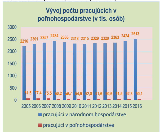
Graf č.2 - Vývoj počtu pracujúcich ľudí v národnom hospodárstve a v poľnohospodárstve (v tis. osôb)