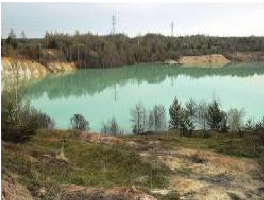
Skládka nebezpečných odpadů (laguna)

Hlavní cíle odpadového hospodářství Slovenské republiky byly stanoveny v Programu odpadového hospodářství Slovenské republiky (POH SR) do roku 2005, který schválila vláda Slovenské republiky dne 27. 2. 2002. POH SR byl zpracován v návaznosti na zákon o odpadech č. 223/2001 Z. z. (zákon o odpadech), respektoval v té době probíhající proces transpozice právních předpisů EU a obsahoval zejména charakteristiku aktuálního stavu odpadového hospodářství, strategii jeho řízení, závaznou a směrnou část a rozpočet.