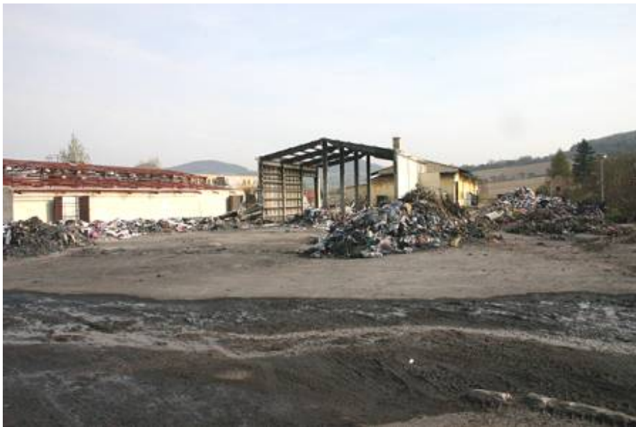
Skládka nelegálně dovezených odpadů po požáru

Kontrolou u vybraných FÚ byla zjištěna 64% úspěšnost vymáhání pokut.