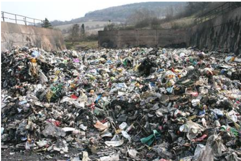
Skládka nelegálně dovezených odpadů

Dovoz odpadů do ČR i SR k odstranění je až na výjimky zakázán. Z důvodu nejasnosti legislativy se vyskytuje velký počet subjektů, které deklarují odpad jako výrobek. Tyto subjekty nejsou při současném stavu legislativy kontrolovatelné.