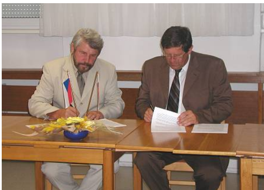
Podpis zápisu ze společného jednání

Koordinované kontroly potvrdily prospěšnost spolupráce nejvyšších kontrolních úřadů.