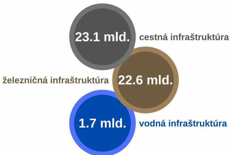
Schéma 4 - Kvalifikovaný odhad finančných prostriedkov na dobudovanie nezrealizovaných prostriedkov

Na dobudovanie nezrealizovaných projektov vyplývajúcich zo stratégie predstavuje kvalifikovaný odhad finančných prostriedkov v oblasti cestnej infraštruktúry sumu 23,1 mld. eur , v železničnej 22,6 mld. eur a vodnej 1,7 mld. eur