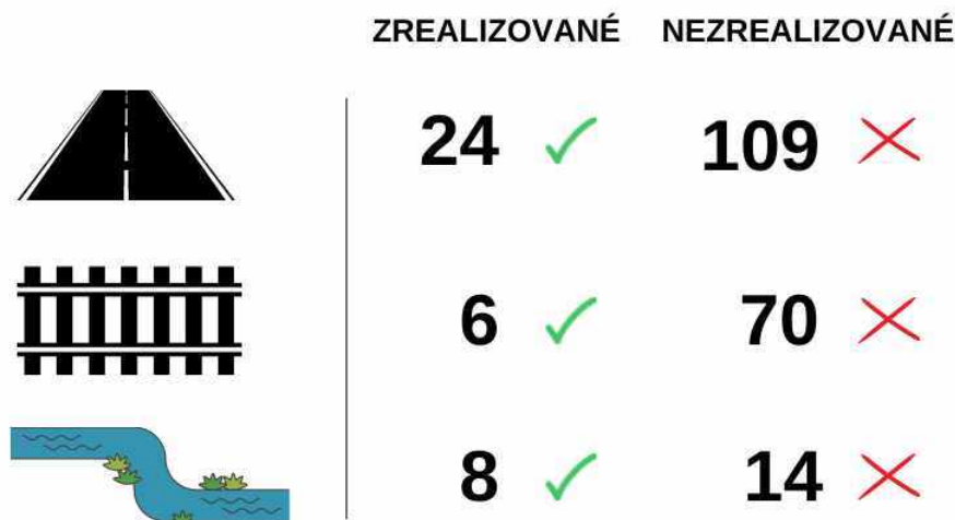
Schéma 1 - Prehľad počtu zrealizovaných a nezrealizovaných projektov v rámci fázy I. a fázy II.