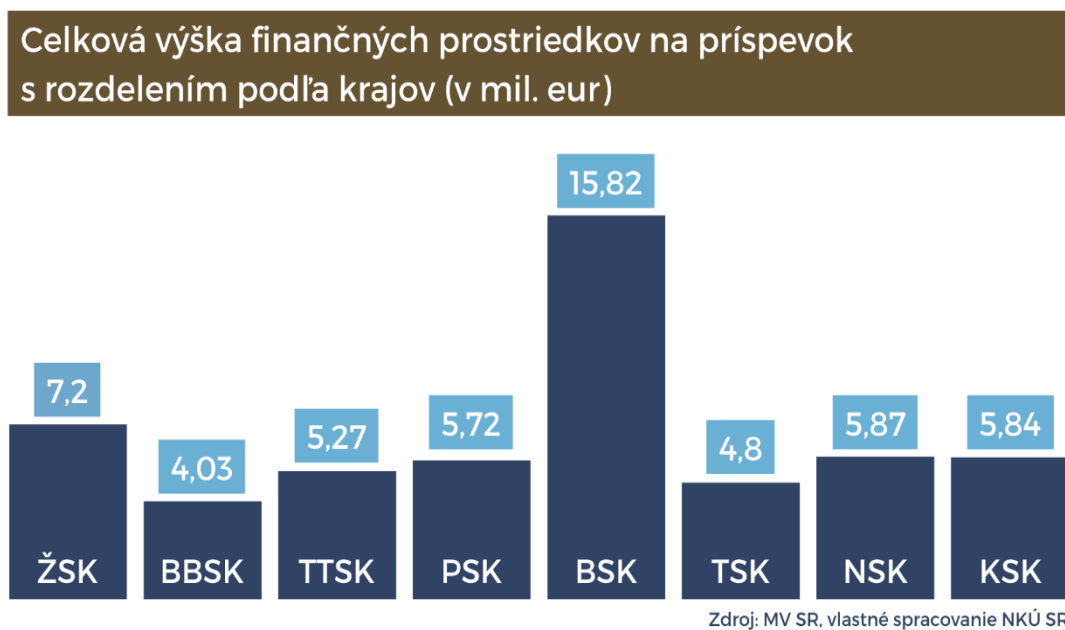
Graf č. 2: Celková výška finančných prostriedkov na príspevok s rozdelením podľa krajov (v mil. eur)

V rámci porovnania za celú SR bolo najviac finančných prostriedkov na príspevok vynaložených v Bratislavskom kraji a najmenej v Banskobystrickom kraji. Suma vyplateného príspevku pre fyzické osoby presahovala 46 mil. eur a pre právnické osoby 8 mil. eur .