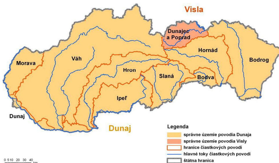
Obrázok č. 3. Správne územia povodí na území Slovenskej republiky a ich čiastkové povodia