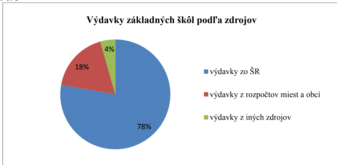
Graf č. 3

Vykonanými kontrolami boli preverené verejné prostriedky poskytnuté základným školám zo ŠR a z rozpočtov zriaďovateľov v celkovej sume 6 956 327 eur. Doklady k prevereniu boli vybrané náhodným výberom na základe úsudku kontrolóra. Pri ich kontrole bol uplatnený prístup detailného preverovania.