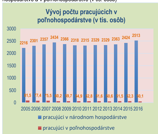
Graf č.2 - Vývoj počtu pracujúcich ľudí v národnom hospodárstve a v poľnohospodárstve (v tis. osôb)