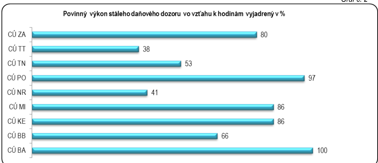
Graf č. 2

Efektívnosť využitia pracovného času vyjadrená pomerom hodín len povinného výkonu stáleho daňového dozoru k celkovým hodinám za kontrolované obdobie podľa jednotlivých colných úradov dokumentuje graf č. 2.