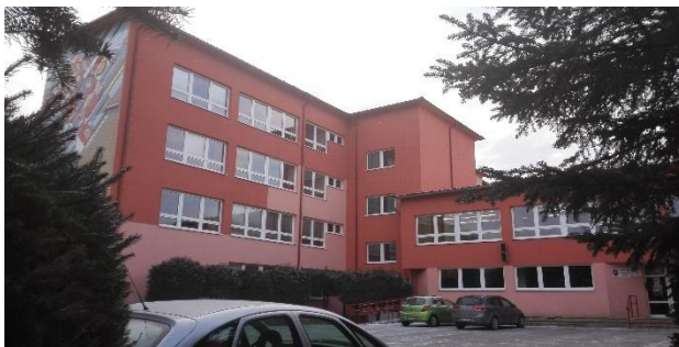
Obr. 1 Zrekonštruovaná ZŠ Akademia J. Hronca, Rožňava