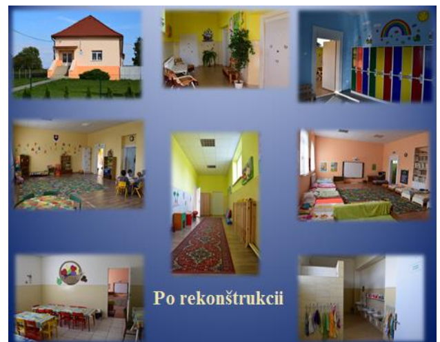
Obr. 2 Zrekonštruovaná MŠ Veľké Ozorovce

Taktiež sa zaviazali, že udržia počet existujúcich tried aj počet nových tried, ktoré vznikli z prijatej dotácie, ako aj počet pedagogických zamestnancov po dobu siedmich nasledujúcich rokov. V prvom roku po prijatí dotácie bola uvedená podmienka dodržaná u všetkých príjemcov dotácie.